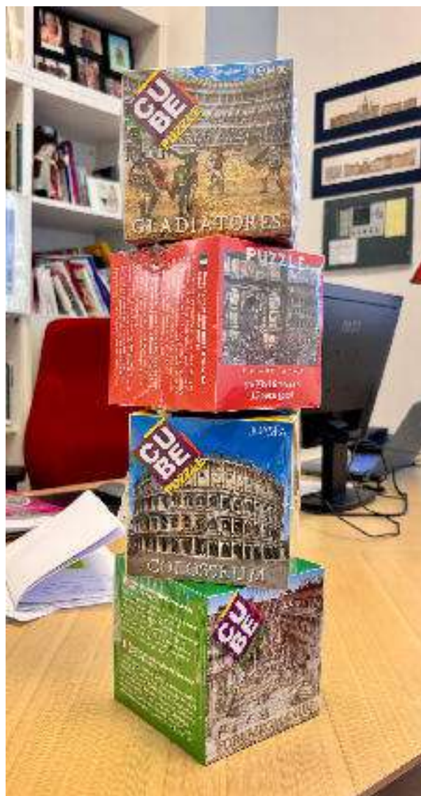
Foto del prodotto