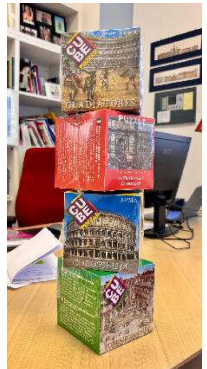
Foto a colori del prodotto

Puzzle in cartoncino 23x 16 cm con immagini che rappresentano l'antica Roma