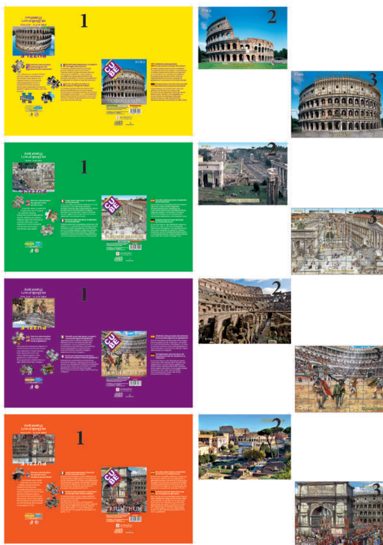
Foto con esploso del giocattolo